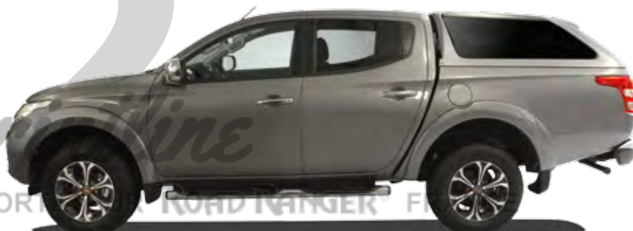
HARD TOP RH4 DC FENÊTRES LATÉRALES RIGIDES ET TEINTÉES