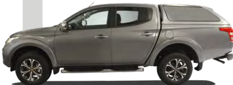
HARD TOP RH4 DC SANS OUVERTURE LATÉRALE