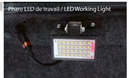
Phare LED de travail / LED Working Light