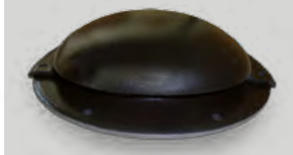
Event de toit / Roof Exhauster