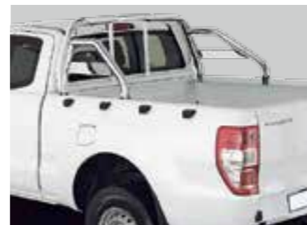
Arceau avec le Roll-N-Lock 15V4119