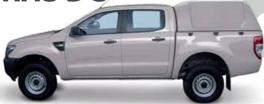
HARD TOP RH3 DC STANDARD