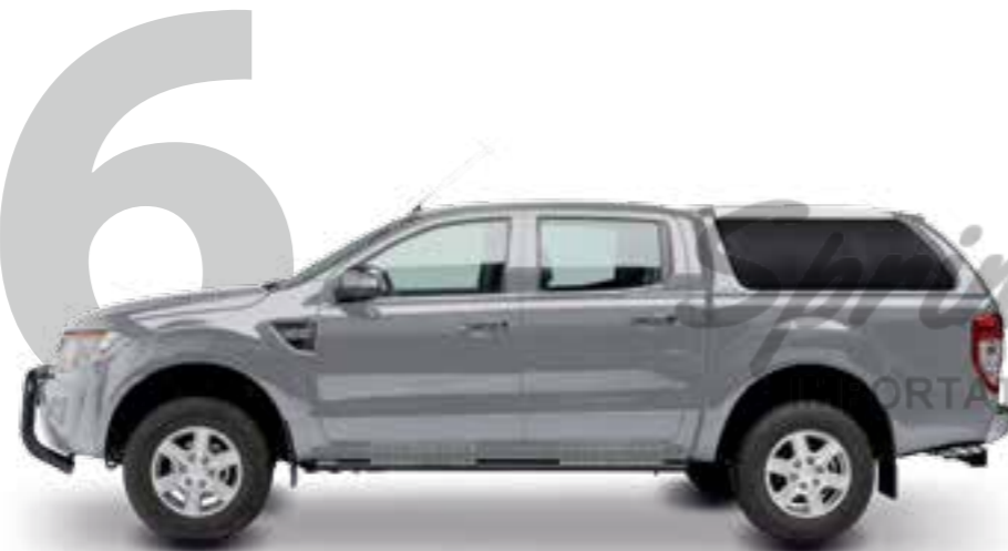
HARD TOP RH4 DC SPÉCIAL