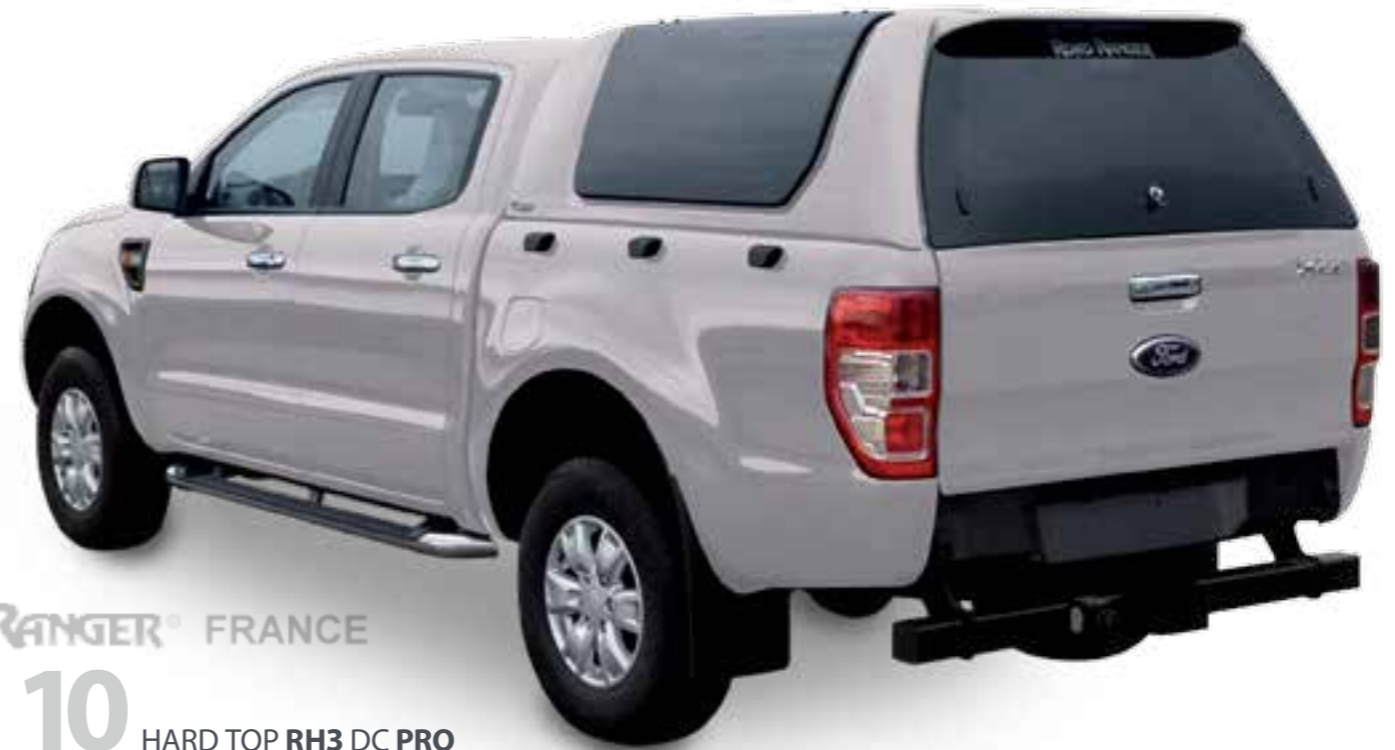
10 HARD TOP RH3 DC PRO

Sprintline IMPORTATEUR ROAD RANGER® FRANCE