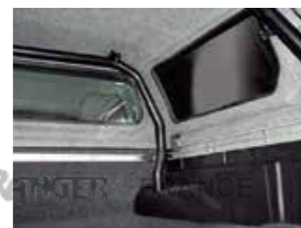
SYSTÈME DE TRANSPORT DE CHARGE COMPLET / CARRIER SYSTEM