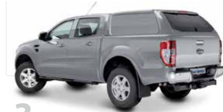
3 HARD TOP RH4 DC PRO