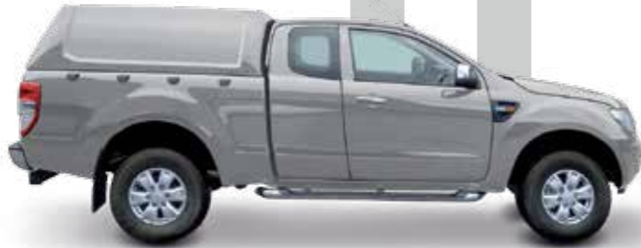
HARD TOP RH3 CC STANDARD