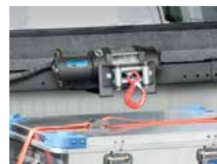
SYSTÈME DE TREUIL POUR LA BENNE WINCH SYSTEM