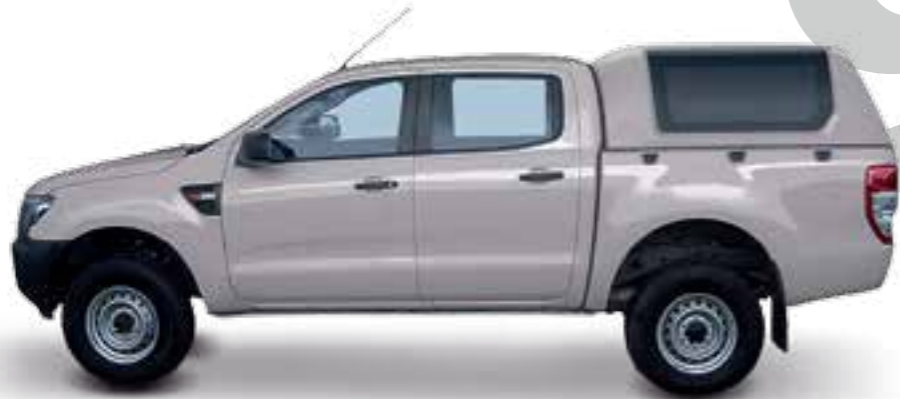
HARD TOP RH3 DC SPÉCIAL