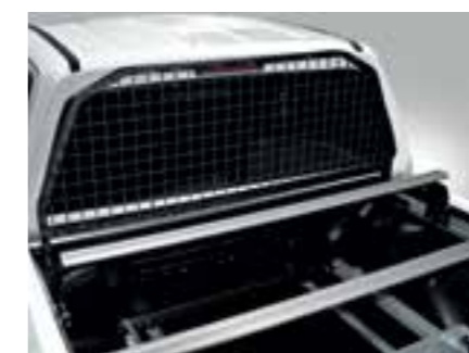
GRILLE DE PROTECTION DE FENÊTRE ARRIÈRE / REAR WINDOW PROTECTION GUARD