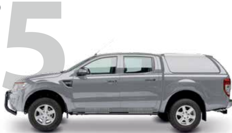
HARD TOP RH4 DC STANDARD