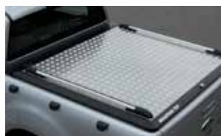
Alu cover DC & CC avec rails sport MTFO91A201