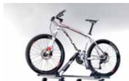
Porte vélo Giro AF 082220