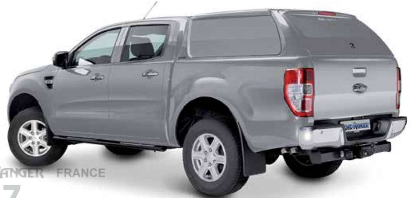
7 HARD TOP RH4 DC PRO