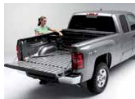
Bed X-Tender RCMF090

Road Ranger – Dr. Höhn est le partenaire commercial officiel de tous les articles Roll-N-Lock.