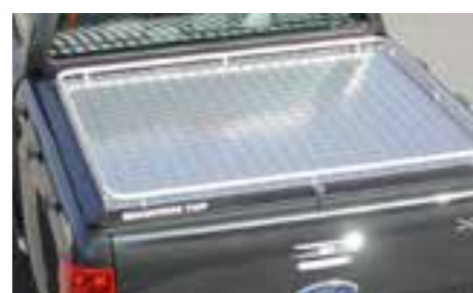
Alu cover DC & CC avec rails sur les côtés MTFO91A101