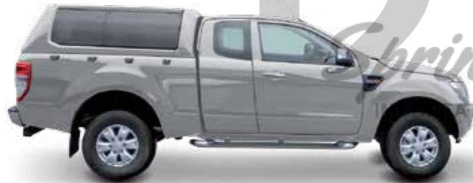
HARD TOP RH3 CC SPÉCIAL