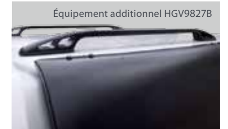
Équipement additionnel HGV9827B