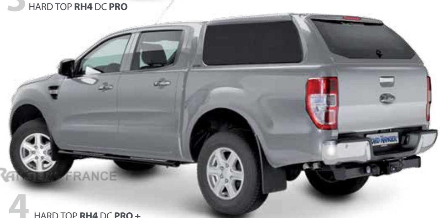
4 HARD TOP RH4 DC PRO +