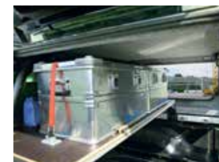
ÉTAGÈRES EN BOIS + BARRES TRANSVERSALES / BASE PLATE + CROSS BAR

Art.-Nr. W502125/W502127 + 240025 PAGE / PAGE 24