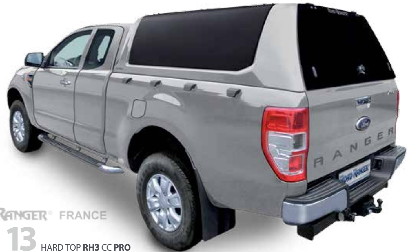
13 HARD TOP RH3 CC PRO