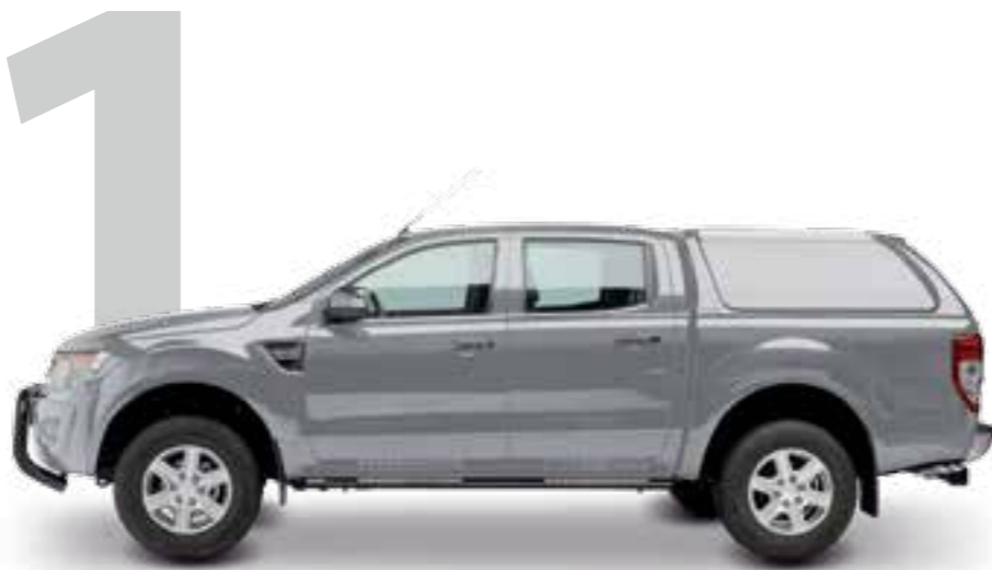
HARD TOP RH4 DC STANDARD