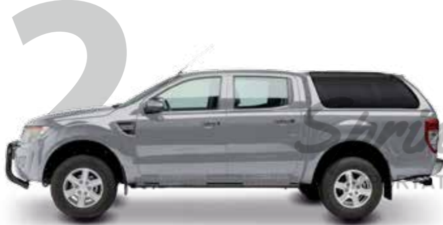
HARD TOP RH4 DC SPÉCIAL